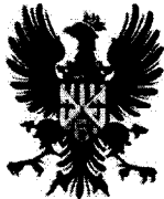
Comune di Castroreale